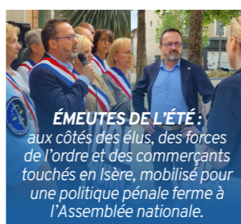
ÉMEUTES DE L'ÉTÉ : aux côtés des élus, des forces de l'ordre et des commerçants touchés en Isère, mobilisé pour une politique pénale ferme à l'Assemblée nationale.