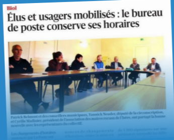
Elus et usagers mobilisés : le bureau de poste conserve ses horaires